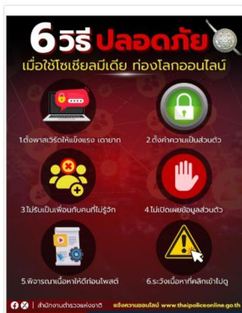
????รู้ไว้.. เมื่อใช้โซเชียลมีเดีย ท่องโลกออนไลน์ กับ 6 วิธีใช้อย่างปลอดภัย

ลิงค์ที่มา : http://samoeng.chiangmaipolice.go.th/activity_sub.php?id_act=2385