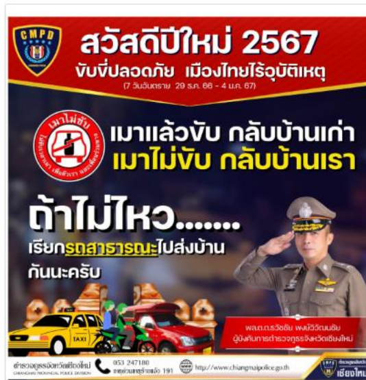
ขับขี่ปลอดภัย เมืองไทยไร้อุบัติเหตุ (7 วันอันตราย 29 ธ.ค.66- 4 ม.ค.67)

รายละเอียด : ตำรวจภูธรจังหวัดเชียงใหม่ สวัสดิ์ปีใหม่ 2567 ขับขี่ปลอดภัย เมืองไทยไร้อุบัติเหตุ (7 วันอันตราย 29 ธ.ค.66- 4 ม.ค.67)