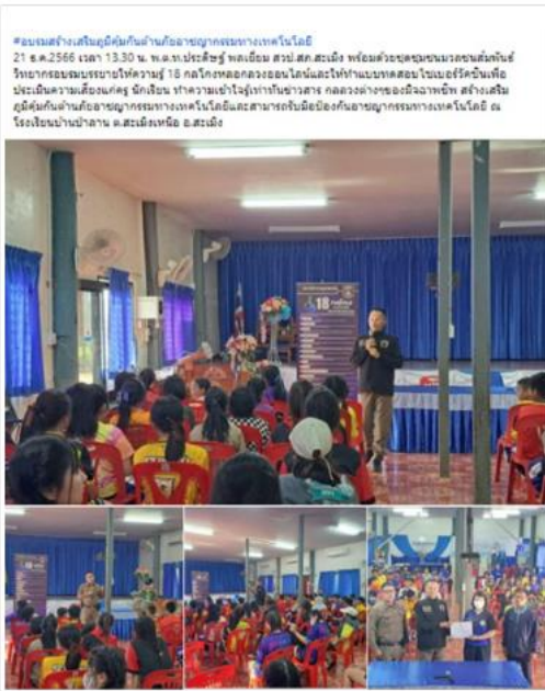
#อบรมสร้างเสริมภูมิคุ้มกันด้านภัยอาชญากรรมทางเทคโนโลยี